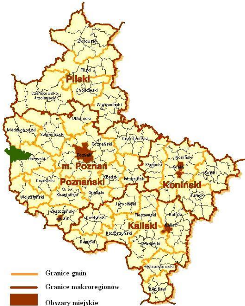
Polozenie gminy na tle wojewodztwa wielkopolskiego