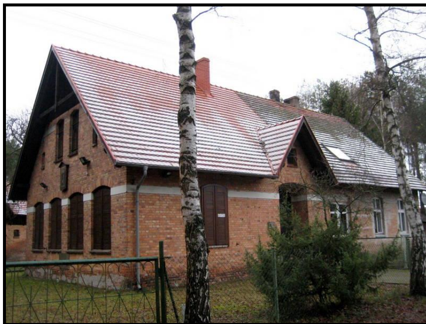
Kwatera myśliwska Koła Łowieckiego nr 39 „WYCINEK”

ZASOBY – wszelkie elementy materialne i niematerialne wsi i związanego z nią obszaru, które mogą być wykorzystane obecne badź w przyszłości w realizacji publicznych bądź prywatnych przedsięwzięć odnowy wsi. Zwrócić uwagę na elementy specyficzne i rzadkie (wyróżniające wieś). Opracowanie: Ryszard Wilczyński