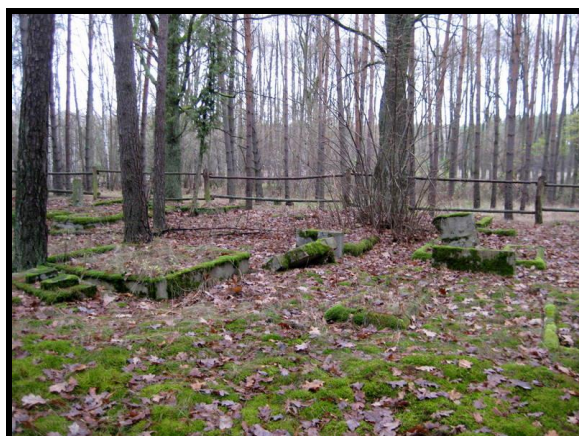
Pozostałości cmentarza ewangelickiego