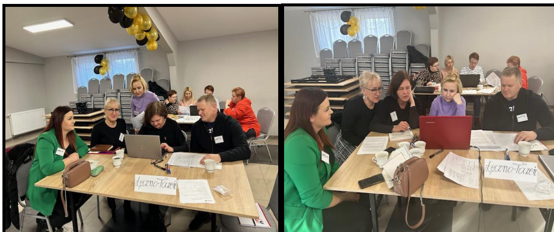
Grupa Odnowy Wsi w czasie warsztatów opracowania Sołeckiej Strategii Rozwoju Świetlice wiejskie we Władysławowie oraz Grońsku w dniach 20 i 27 stycznia 2024 r.

SOŁECKA STRATEGIA ROZWOJU – ŁĘCZNO-TOCZEŃ wypracowana przez GOW na warsztatach w ramach programu UMWW - „Wielkopolska Odnowa Wsi 2020+”