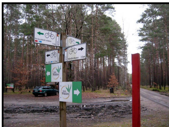
Oznakowane szlaki rowerowe oraz wikliny