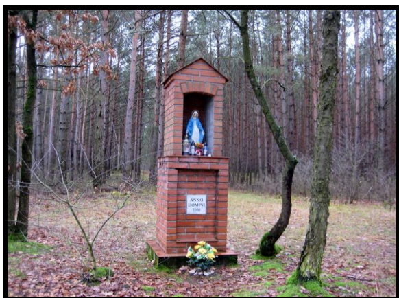
Miejsce kultu religijnego