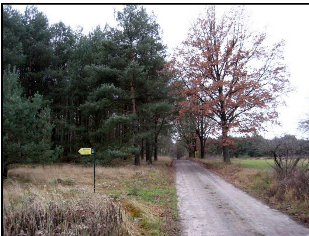
Walory przyrodnicze sołectwa

SOŁECKA STRATEGIA ROZWOJU – ŁĘCZNO-TOCZEŃ wypracowana przez GOW na warsztatach w ramach programu UMWW - „Wielkopolska Odnowa Wsi 2020+”