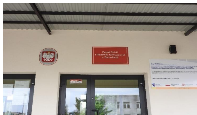
Zdjęcie 13 Zespół szkół i placówek oświatowych