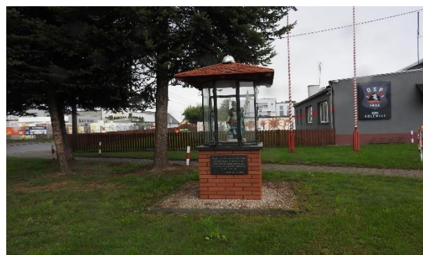
Zdjęcie 11 Remiza OSP w Bolewicach