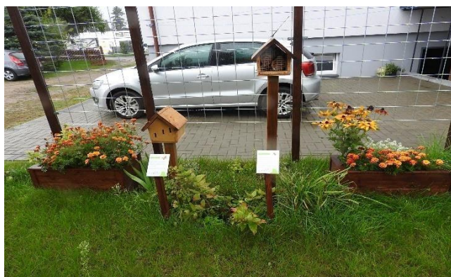
Zdjęcie 12 Ogródek wypoczynkowy zagospodarowany