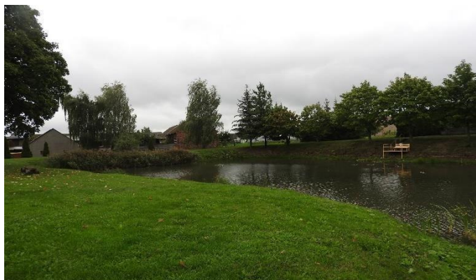
Zdjęcie 14 Teren nad stawem do zagospodarowania