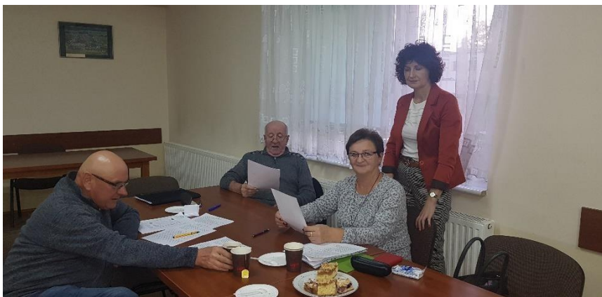
Zdjęcie 2 Warsztaty pisania SSR – październik 2021

Drugie warsztaty odbyły się w dniu 23.10.2021 roku. Warsztaty w tym dniu polegały na wykazaniu, na podstawie przeprowadzonych wcześniejszych analiz, zamierzeń projektowych. Tak powstał plan długi i krótkoterminowy. W planie krótkoterminowym wskazano te projekty/zadania, które mieszkańcy sołectwa planują zrealizować w pierwszej kolejności – w okresie 12 miesięcy. Następnie w ramach planu długoterminowego zaplanowano zadania na lata przyszłe. W planie długoterminowym wskazano cele jakie sołectwo stawia sobie do osiągnięcia, w poszczególnych kategoriach potencjału rozwojowego.