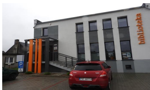
Zdjęcie 9 Budynek biblioteki