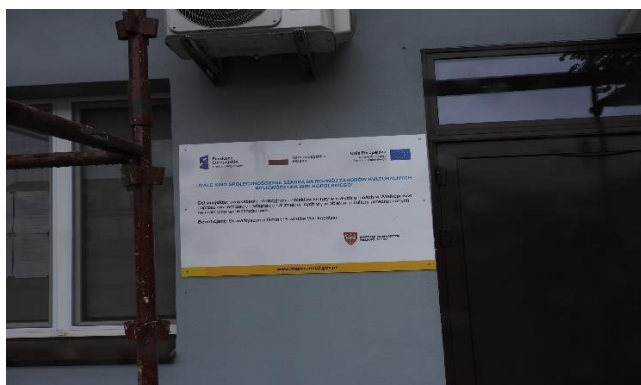
Zdjęcie 6 Budynek Świetlicy wiejskiej w przebudowie