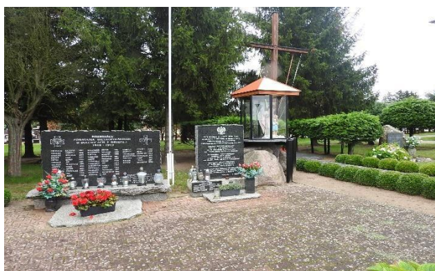
Zdj. 17 Obelisk bohaterów Powstania Wlkp. i II wojny światowej