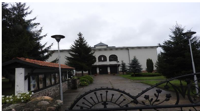
Zdjęcie 16 Kościół parafialny p.w. Chrystusa Króla