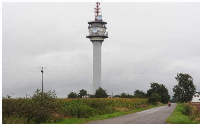
Zdjęcie 15 Wieża radiowa-telewizyjna