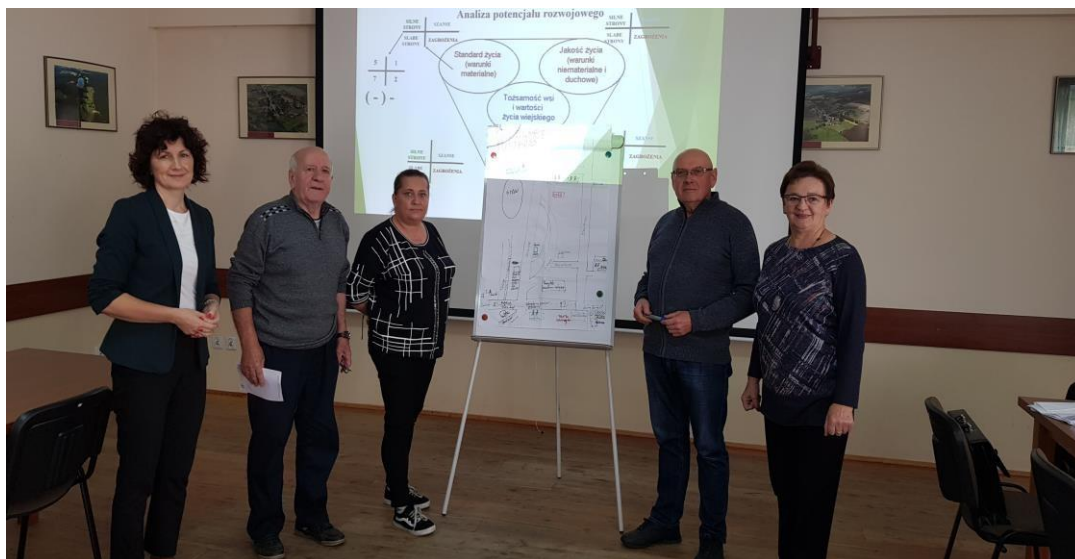
Zdjęcie 14 Praca grupowa – prezentacja wizji rozwoju sołectwa Bolewice