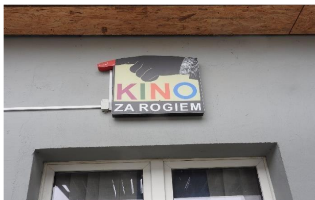
Zdjęcie 7 Budynek świetlicy, gdzie realizuje się projekt