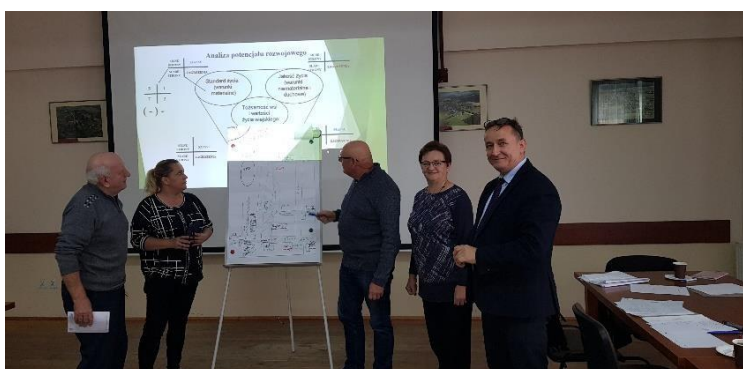
Zdjęcie 3 Warsztaty pisania SSR – październik 2021

Przedstawiciele Grupy odnowy wsi wykonali również graficzną wizję miejscowości – którą następnie zaprezentowali pozostałym uczestnikom warsztatów.