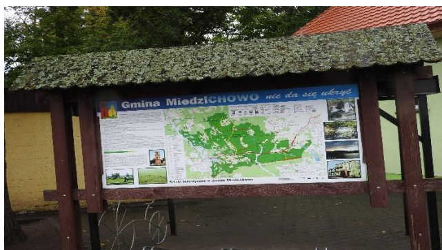
Zdjęcie 10 Tabl. informacyjna-turystyczna gminy Miedzichowo