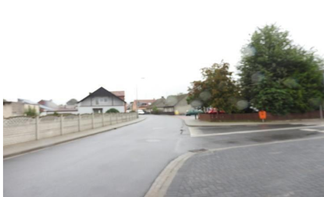
Zdjęcie 8 Zabudowa ulicowa w starszej części sołectwa