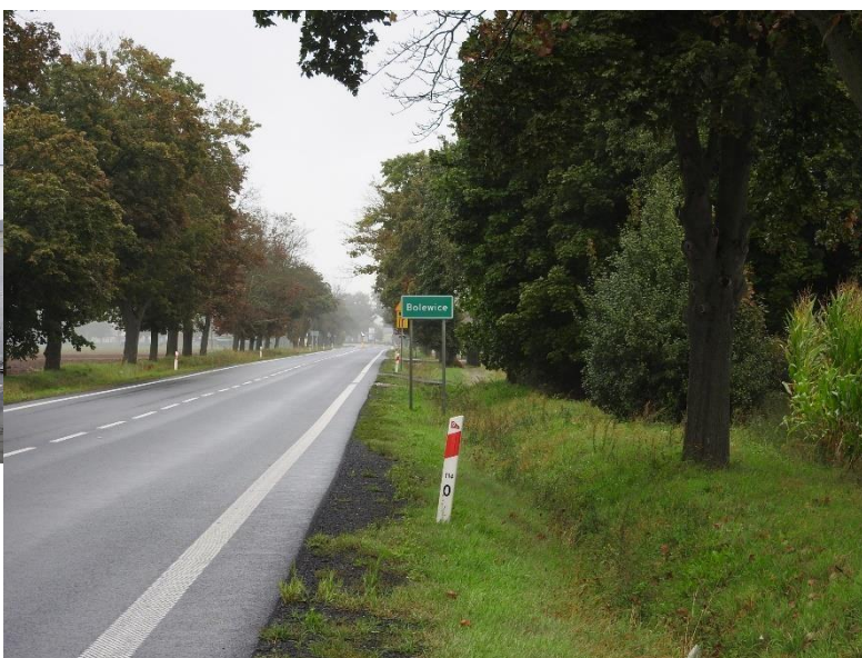
Zdjęcie 5 Wjazd do Bolewic