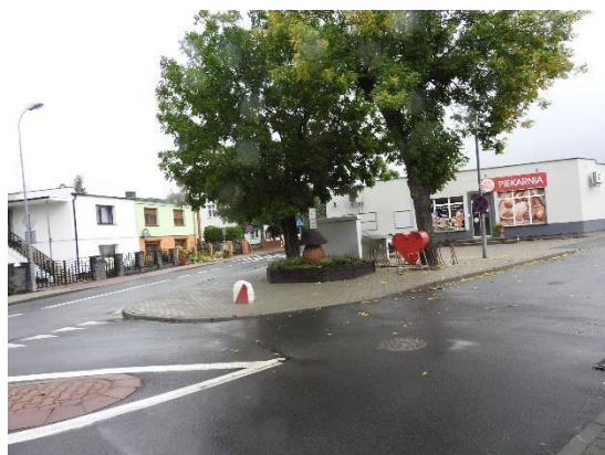
Zdjęcie 4 Wieś Bolewice – skwer zieleni

W roku 1904 wybuchł wielki pożar, który strawił 70% wsi. Na pamiątkę tego wydarzenia postawiono kapliczkę "Boża Męka", a w parku ustawiono figurę symbolizującą pożar. W 1944 r. w Bolewicach założono hitlerowski obóz pracy przymusowej obywateli żydowskich, budujących autostradę. Miejscowość jest siedzibą nadleśnictwa, założonego w 1848 r. W latach 1933-1936 wzniesiono kościół parafialny pod wezwaniem Chrystusa Króla. Parafię erygowano w 1946 r. W byłym parku dworskim znajduje się sala wiejska, lapidarium i wiklinowa brama, przypominająca dawną majątkową. Charakterystycznym punktem Bolewic jest wieża radiowo-telewizyjna o wys. 82 m. Przebiega tu rowerowy szlak wiklinowy, odzwierciedlający tradycje wikliniarskie okolicy. Obecnie wieś posiada podstawową infrastrukturę materialną, usługowo-handlową, obiekty dydaktyczno-kulturalne, sportowe i medyczne, co zachęca przedsiębiorców do inwestowania, a chętnych do osiedlania.