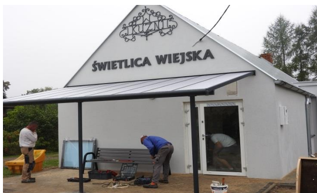
Zdjęcie 6 Budynek Świetlicy wiejskiej „KUŹNIA”