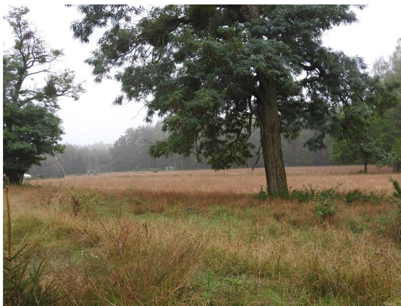
Zdjęcie 4 Wieś Lewiczynek otoczony lasem

Wieś liczy niespełna 90 mieszkańców. Leśne otoczenie Lewiczyńka sprawia, że część społeczności lokalnej czerpie dochody z bogactwa naturalnego jakim są lasy. Mieszkają tutaj pracownicy Nadleśnictwa Bolewice oraz zakładów usług leśnych, znajduje się tutaj rodzinna firma transportu leśnego, rozwojowy zakład produkujący domki drewniane oraz składnica drewna Lasów Państwowych. Mieszkańcy oraz przyjezdne osoby chętnie korzystają z płodów runa leśnego co sprawia, że w Lewiczyńku znajdują się dwa punkty skupu grzybów. Są tutaj też osoby zajmujące się zaopatrywaniem ludności w drewno opałowe. W sołectwie funkcjonują dwa nieduże gospodarstwa rolne. Pozostała część mieszkańców znajduje zatrudnienie w okolicznych miejscowościach poza Lewiczyńkiem.