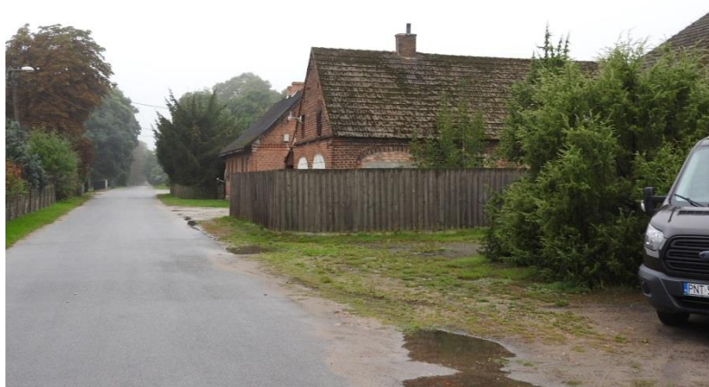
Zdjęcie 5 Wjazd do Lewiczyńka

Lewiczynek jest spokojną, przyjazną wioską pozbawioną patologii społecznych otwartą na ruch turystyczny z dużym potencjałem aktywizacji mieszkańców.