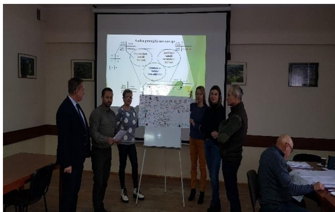
Zdjęcie 14 Praca grupowa – prezentacja wizji rozwoju sołectwa Lewiczynek