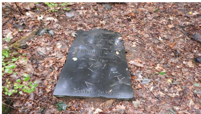
Zdjęcie 10 Pozostałości zabytkowego cmentarza ewangelickiego