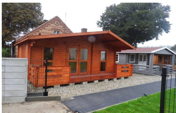
Zdjęcie 13 Zakład produkcji domków letniskowych