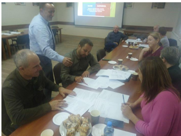
Zdjęcie 2 Warsztaty pisania SSR – październik 2021

Drugie warsztaty odbyły się w dniu 23.10.2021 roku. Warsztaty w tym dniu polegały na wykazaniu, na podstawie przeprowadzonych wcześniejszych analiz, zamierzeń projektowych. Tak powstał plan długo i krótkoterminowy. W planie krótkoterminowym wskazano te projekty/zadania, które mieszkańcy sołectwa planują zrealizować w pierwszej kolejności – w okresie 12 miesięcy. Następnie w ramach planu długoterminowego zaplanowano zadania na lata przyszłe. W planie długoterminowym wskazano cele jakie sołectwo stawia sobie do osiągnięcia, w poszczególnych kategoriach potencjału rozwojowego.