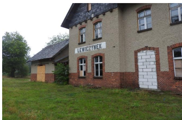
Zdjęcie 7 Budynek Dworca PKP