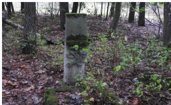
Zdjęcie 11 Pozostałości zabytkowego cmentarza ewangelickiego