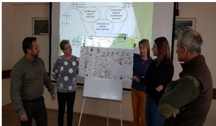
Zdjęcie 3 Warsztaty pisania SSR – październik 2021

Przedstawiciele Grupy odnowy wsi wykonali również graficzną wizję miejscowości – którą następnie zaprezentowali pozostałym uczestnikom warsztatów.