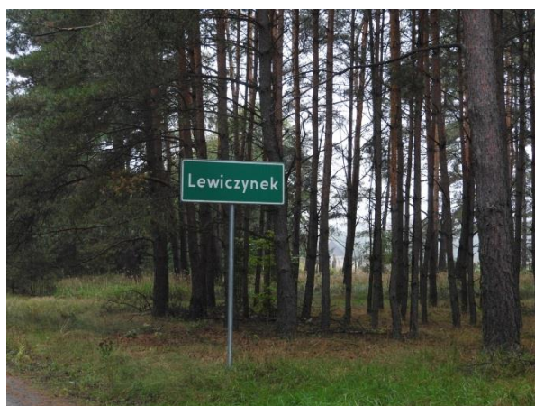
Zdjęcie 1 Wjazd do miejscowości Lewiczynek