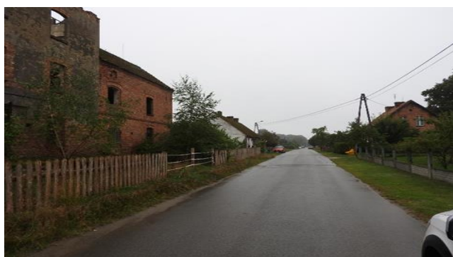
Zdjęcie 8 Zabudowa ulicowa w starszej części sołectwa