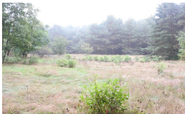
Zdjęcie 12 Teren przeznaczony pod zagospodarowanie infrastrukturą rekreacyjno-sportową