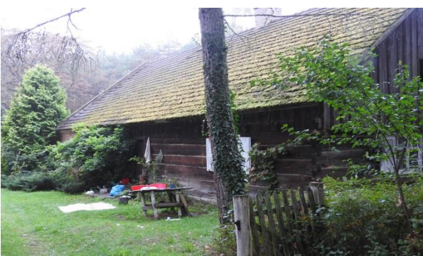
Zdjęcie 9 Budynek „Olenderski”